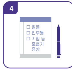
대상자, 보호자 코로나 증상 있을 시 내원 전 알리기