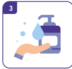
손소독 등 개인위생 수칙 준수