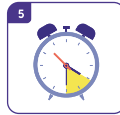
접종 후 현장에서 20~30분 머물며 이상반응 관찰 후 귀가